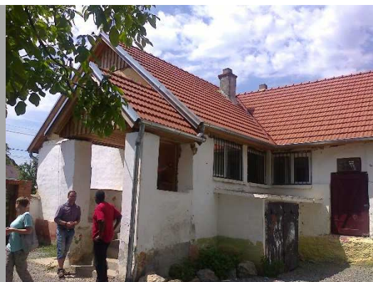
Till höger: NetWorks skola i Eden, Siria.

Taut: Vi besökte också den lägergård och stugby som Network fått ta över och renoverat utanför Taut, ett par mil nordost om Siria. Networks platsansvariga volontär guidade oss runt i stugbyn och berättade om verksamheten med ungdomsläger, musikfestivaler och uthyrning till turister och om den fortsatta utvecklingen av platsen.