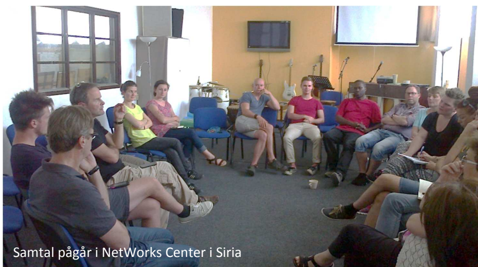
Samtal pågår i NetWorks Center i Siria

Diskussionen under de två dagarna i Siria fördes inte till något avslut. Vi som deltog i resan har fått väldigt mycket information, och ganska omskakande sådan, under kort tid. Det kräver bearbetning innan slutsatser kan dras. Vi har tagit hem den här informationen och vill nu sprida den så brett som möjligt i Forserum, för att sedan kunna börja diskutera tänkbara insatser och åtgärder.