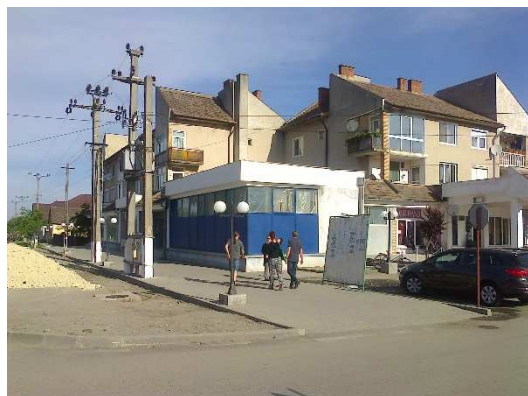
Till vänster: NetWorks Center i Siria på bottenvåningen.

Siria: I småstaden Siria (ca 8.000 invånare) besökte vi Network's Center med secondhandbutik och Network's skola i Edenkvarteren i Siria, där också det av Network startade mikroföretaget Dece's lokal för tillverkning av stickade och sydda mössor finns. Vi hälsade på hos en familj som med Network's stöd har startat odling i växthus av potatis, grönsaker och fröer och vandrade runt i stadsdelen med Networks verksamhetsansvarige volontär.