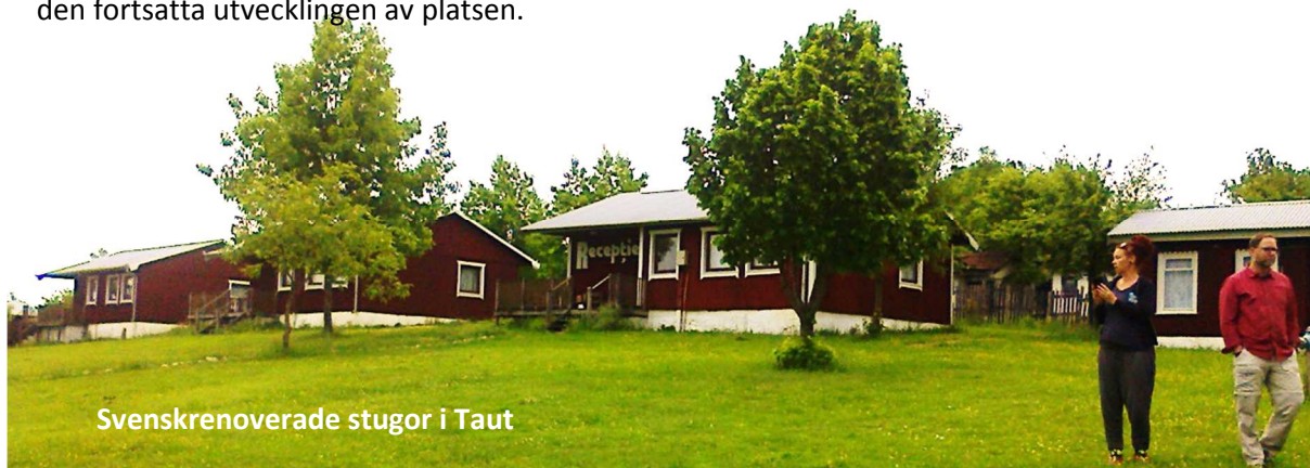
Svenskrenoverade stugor i Taut

Taut: Vi besökte också den lägergård och stugby som Network fått ta över och renoverat utanför Taut, ett par mil nordost om Siria. Networks platsansvariga volontär guidade oss runt i stugbyn och berättade om verksamheten med ungdomsläger, musikfestivaler och uthyrning till turister och om den fortsatta utvecklingen av platsen.